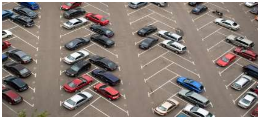
2-rasm. Avtoturagohlarda transport vositalarining joylashuvi.

Yuqorida aytib o‘tilgan omillarga qo‘shimcha ravishda, dizaynerlar to‘xtash joyi dizaynining atrof-muhitga ta‘sirini ham baholashlari kerak. Materiallarni tanlash va tugatish loyihaning maqsadlari va byudjetiga mos kelishi kerak. Qurilish xarajatlari smetasi va jadvalini ishlab chiqish loyihaning moliyaviy jihatdan maqsadga muvofiqligini va talab qilingan muddatda bajarilishini ta‘minlaydi.