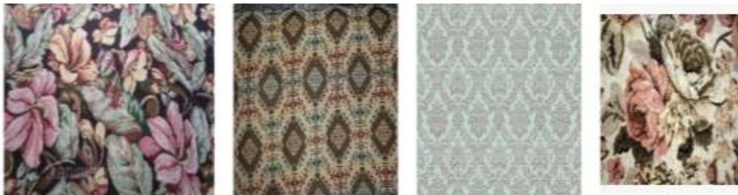
1-rasm. Statik kompozitsiyali naqshlar.

Naqsh va to‘qimachilik bezaklari kompozitsiyasiga ikki xolat xosdir: nisbatan tinch va harakat xolatlari. Naqsh elementlarining motivlari proporsional munosabatda qurilgan naqsh kompozitsiyasi bir hil, teng va simmetriyaga asoslangan bo‘lsa uni statik kompozitsiyaga kiritish mumkin.