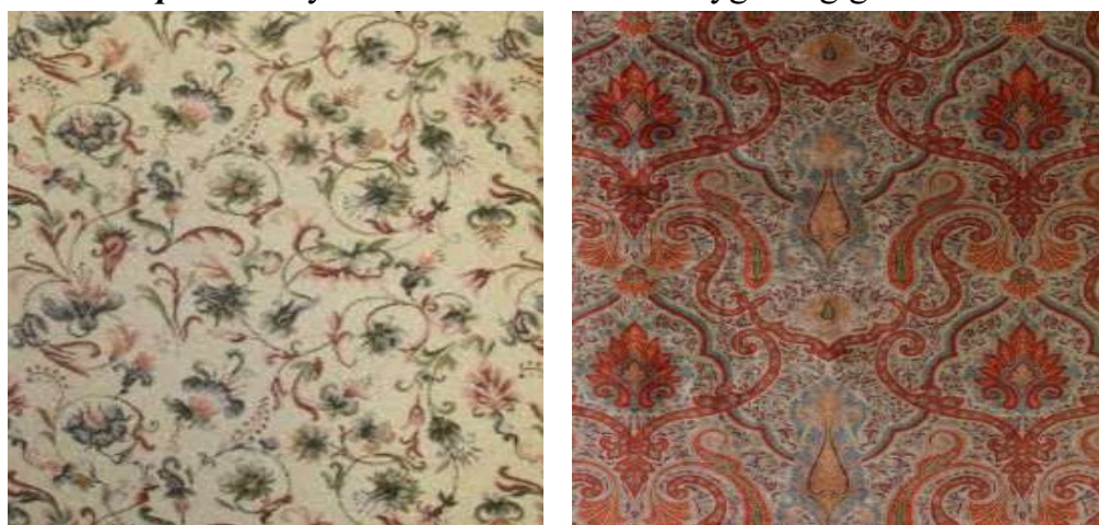
6-rasm. Ritmik va plastik xarakterli naqshlar.

Naqshni ritmik va plastik harakatlar xarakterlaydi. Ritmik harakat deganda naqsh dog‘larini bir hil yoki turli interval orasida takrorlanish nazarda tutiladi. Plastik harakatlar deganda esa ravon, uzun va uzilmas va shu bilan birga bir harakatdan ikkinchisiga o‘tuvchi harakatlar tushuniladi. To‘qimachilik naqshlar kompozitsiyasida plastik harakatlar ritmik harakatlardan ustunlik qiluvchi yoki aksi, ritmik harakatlar plastikdan ko‘ra ko‘proq qo‘llanilgan naqshlarni ko‘p uchratish mumkin (8-rasm). Naqsh yaratish jarayonida ikkita qarama-qarshi tizim (statika va dinamika) va motivlarning ritmik va plastik harakati qo‘llanilganda ularning birini dominant qilish, ikkinchisini unga bo‘ysundirish lozim. Bu bo‘ysundirish qonuni deyiladi va u bilan shakllar uyg‘unligiga erishish mumkin.