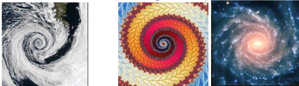
5-rasm. Naqsh va tabiatda uchraydigan oltin kesim.

Dizaynerlar uchun naqsh proporsiyalarini matematik aniqligi emas, balki, ularning inson ko‘ziga yaqqol tashlanadigan oydinligi muhimroq. Kompozisiya maqsadini ravshanligini ta‘minlash uchun statika yoki dinamika bir biridan ustunlik qilishi, rang ochligi, grafik ishlovlari va boshqalar bir biriga nisbatan faol qo‘llanilishi lozim.