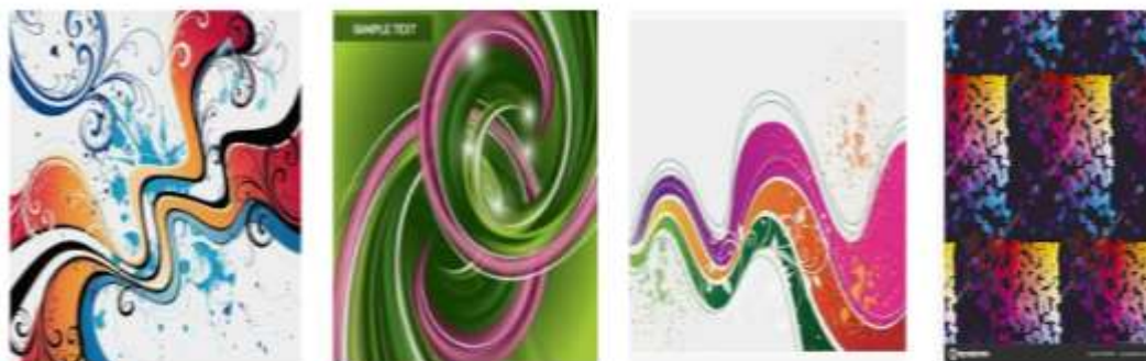
2-rasm. Dinamik kompozitsiyali naqshlar.

Statika va dinamika bu – barcha naqsh san’atining shu jumladan to‘qimachilik naqshlarining asosidir.