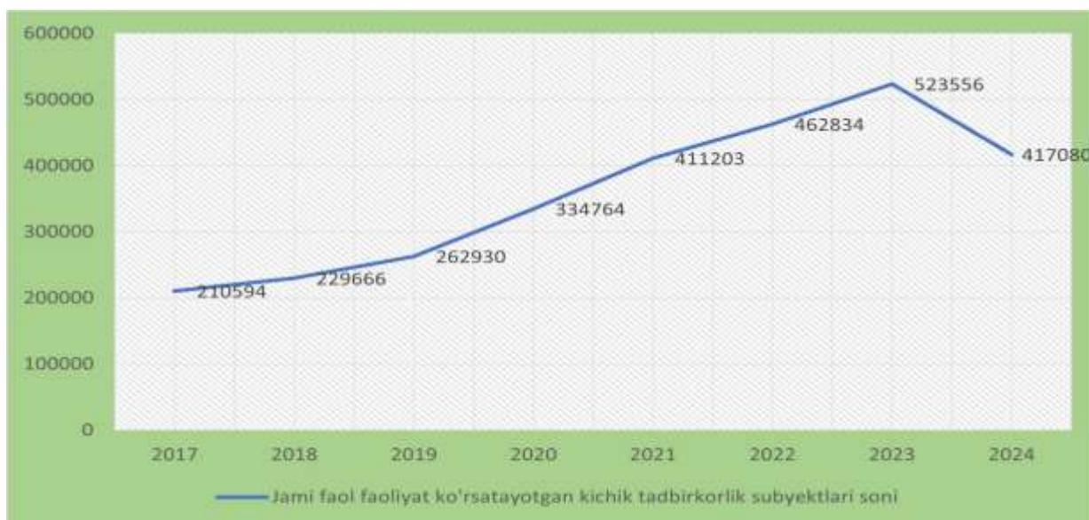
1-rasm. O‘zbekistonda faoliyat yuritayotgan kichik biznes subyektlari soni (2017-2024-yillar oralig‘ida)

O‘zbekiston iqtisodiyotining barqaror rivojlanishi omillaridan biri kichik biznes subyektlarining rivojlanishini ta‘minlashdan iborat. Bu tarmoq bozor kon‘yunkturasining o‘zgarishiga tez moslasha olishi, yangi ish o‘rinlari va daromad manbalarini yaratish orqali aholi bandligini ta‘minlash, o‘rta mulkdorlar sinfini shakllantirish bilan ajralib turadi.